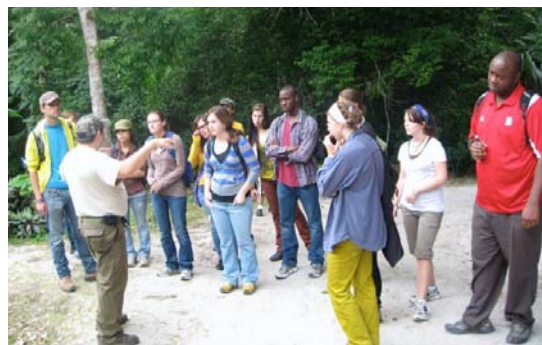
Estudiantes del curso de CIRMA en Tikal

La mayor'ia de estudiantes forman parte de la carrera de Latin American Studies de la Universidad de Arizona. El curso incluyó visitas a los sitios de Tikal, Yaxha e Iximche'.