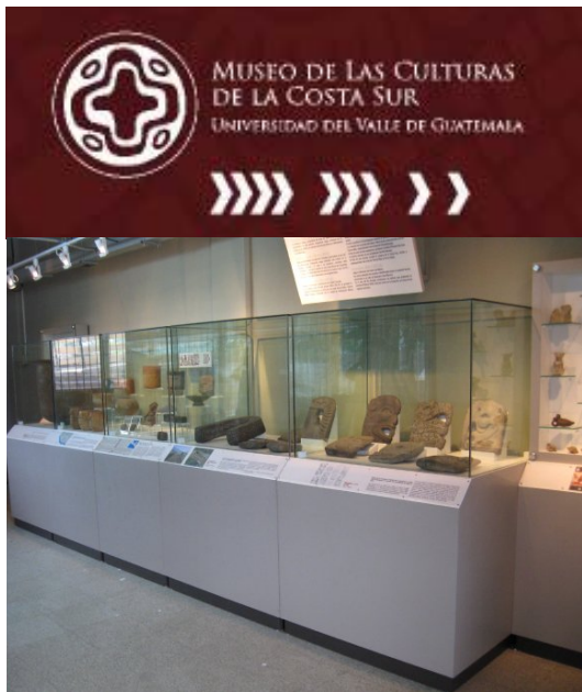
Una de las 3 áreas de exhibición con que cuenta el Museo de las Culturas de la Costa Sur

Nos congratulamos en anunciar que se inauguró el Museo de las Culturas de la Costa Sur en el edificio de la Biblioteca del Campus Proesur. Por ahora La exhibición consta de piezas arqueológicas de la Costa Sur, Altiplano y Petén, que forman parte de una colección privada que ha sido depositada bajo la custodia de la UVG.