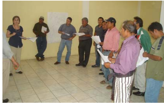
Uno de los grupos de discusión de los asistentes al taller en Santiago Atitlán.