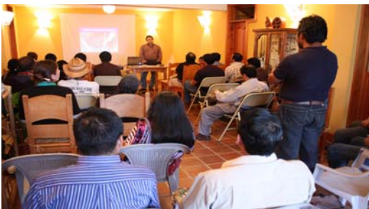
Grupo de asistentes al taller en Santiago Atitlán.