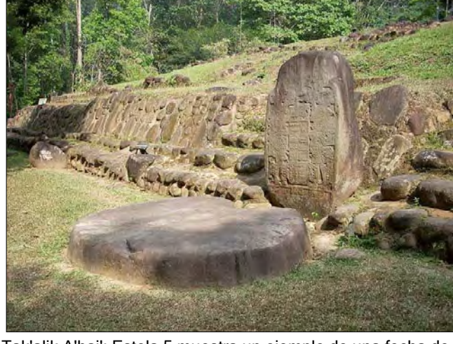
Tak'alik A'bij: Estela 5 muestra un ejemplo de una fecha de la cuenta larga y el altar 8 está a sus pies. Burchell, Simon.