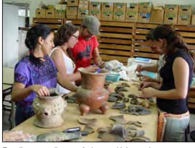
Estudiantes analizan cerámica en el laboratorio.

El Centro de Investigaciones Arqueológicas y Antropológicas -CIAA está dedicado al fomento de la investigación en Guatemala. Con la creación de un Banco de Información, para uso de estudiantes y profesionales, tanto guatemaltecos como extranjeros, se pretende interesar a los mismos a colaborar y así aumentar las oportunidades de participación en proyectos de investigación.